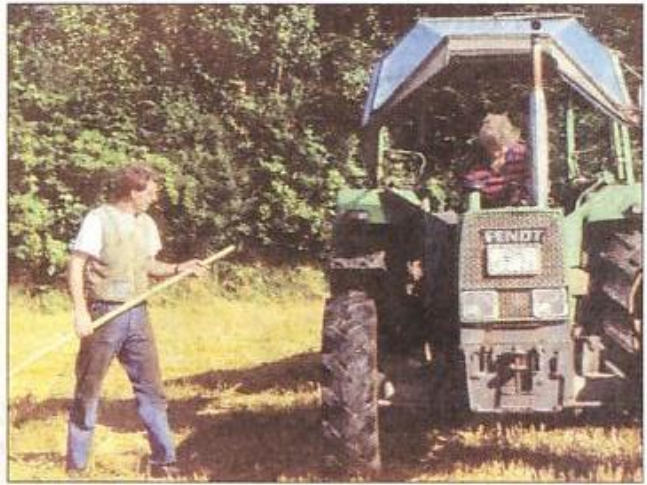
Der Agrartechniker betrieb zusammen mit einem Freund einen kleinen, eigenen Hof mit Schafen, einer Sau und einer Ziege.